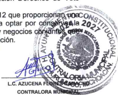
L.C. AZUCENA FLORES CAMACHO CONTRALORA MUNICIPAL