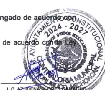
L.C. AZUCENA FLORES CAMACHO CONTRALORA MUNICIPAL