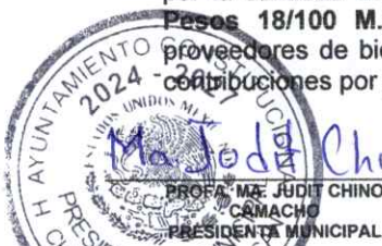
PROFRA. MA. JUDITH CHINO CAMACHO PRESIDENTA MUNICIPAL

2.1.1.7 El apartado de RETENCIONES Y CONTRIBUCIONES POR PAGAR A CORTO PLAZO ; muestra un saldo por la cantidad de $ 26,323,155.18 (Veintiseis Millones Trescientos Veintitres Mil Ciento Cincuenta y Cinco Pesos 18/100 M.N.), importe que representa los montos de las retenciones efectuadas a contratistas y a proveedores de bienes y servicios, las retenciones sobre las remuneraciones realizadas al personal, así como las contribuciones por pagar, todas ellas a muy corto plazo.