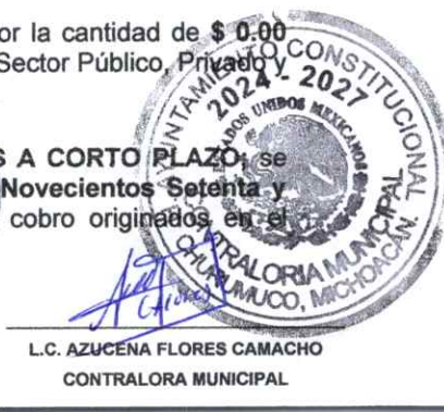
L.C. AZUCENA FLORES CAMACHO CONTRALORA MUNICIPAL